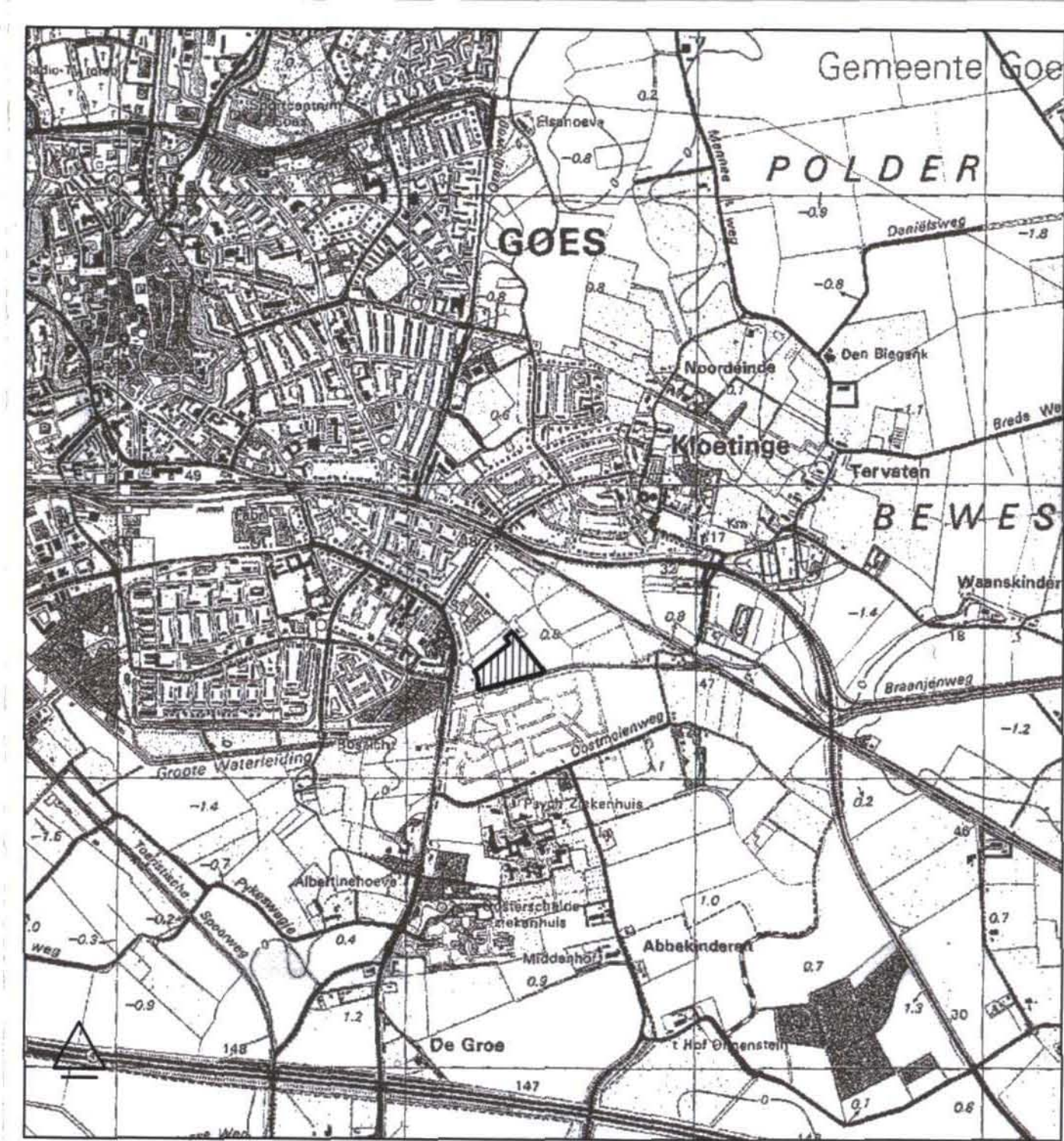
OVERZICHTSSITUATIE SCHAAL 1:20000